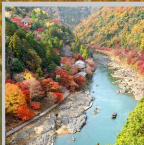
“ARASHIYAMA MT. KAMEYAMA”