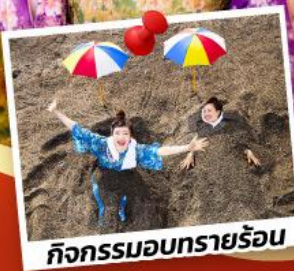
กิจกรรมอบทรายร้อน