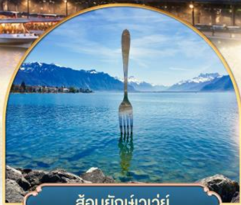
ล้อมยักเขาวัว