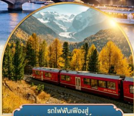
รถไฟฟันเฟืองสู่ ยอดเขากรอนเนอส์เกรต