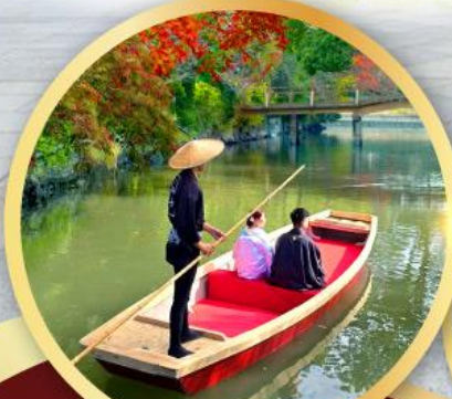
กิจกรรมล่องเรือยามากาวะ