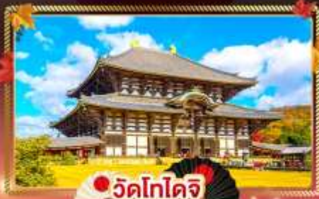
วัดโทโดจิ