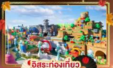
อิสระท่องเที่ยว