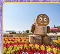
สวนซึกิไซโนะโอะกะ