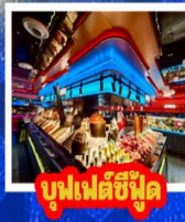
บุฟเฟต์ซีฟู้ด