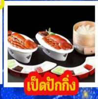
เปิดปิกกิ้ง