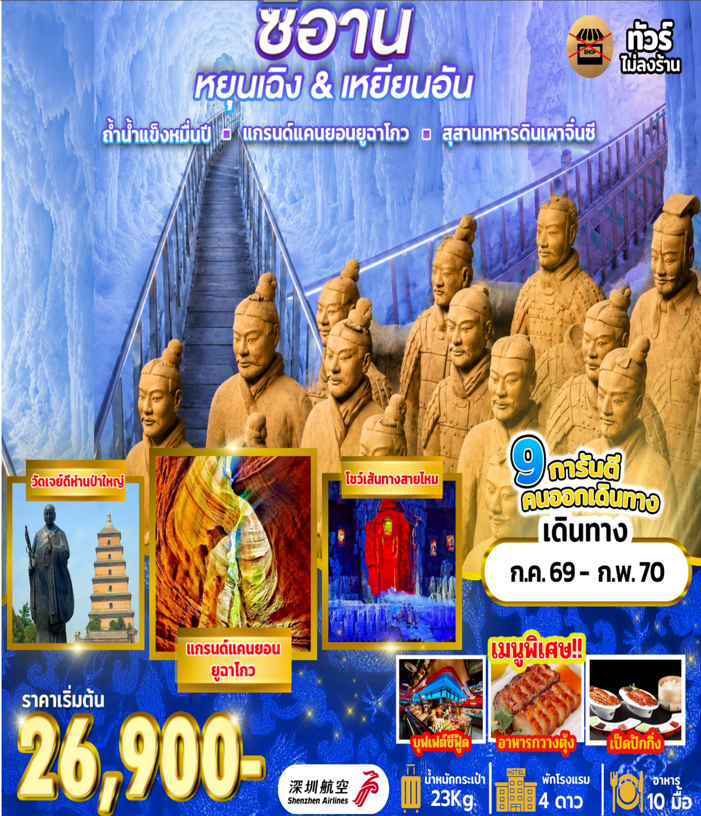
วัดเจย์ดีห่านป่าใหญ่

ถ้ำน้ำแข็งหมื่นปี □ แกรนด์แคนยอนยูลาโก □ สุสานทหารดินเผาฉินซี