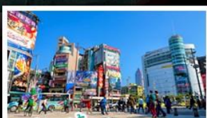
ซ้อปิ้งซีเหมินตัง