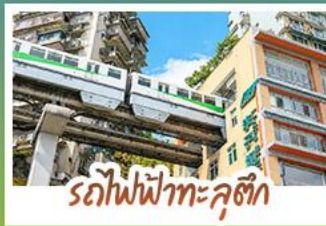
รถไฟฟ้าทะเลสาบสี่ถุณี

ชมธรรมชาติ ณ อุทยานแห่งชาติผดุงงา สดุดึงการระดิมมรดกโลก นั่งรถไฟฟ้าทะเลสาบสี่ถุณี สักยลัษณ์เมืองฉิ่งสุดล้ำ สัมผัสวิถีภูเขาหิมะแห่ง ภูเขาสี่ตรุณี งดงามจนได้รับฉายา "เทือกเขาแอลป์แห่งตะวันออก" ชมธรรมชาติสุดฟิน ณ อุทยานปี่ฝิงโก้ว • ซ้อมปิ้งจู่จู่ ถนนคนเดินไท่ทู่หลู่, ถนนคนเดินซุนซู่