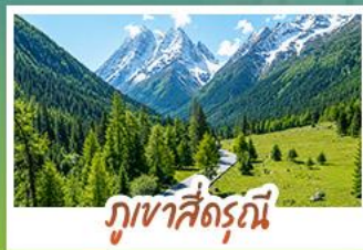
ภูเขาสี่ตรุณี