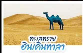
ทะเลทราย อินเคินทาลา