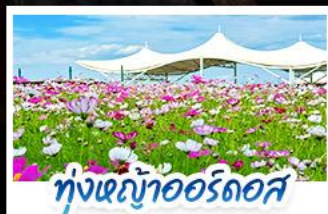
ทุ่งหญ้าแอร์ดอส