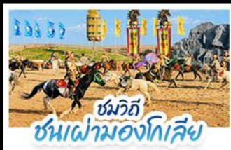
ชมวิถี ชนเผ่ามองโกเลีย

เปิดประสบการณ์ พักแรมมองโกเลียสุดพรีเมียมกลางทุ่งหญ้า สัมผัสบรรยากาศพระอาทิตย์ขึ้นสุดโรแมนติก ชมวิถีชนเผ่ามองโกเลีย พร้อมปาร์ตี้กองไฟใต้ท้องฟ้าเต็มไปด้วยความ • ตะลุยทะเลทรายอินเคินทาลา ทำรูปสุดปังกลางทะเลทรายสีทอง • เที่ยวครบทั้งทุ่งหญ้าแอร์ดอส วัฒนธรรมมองโกเลีย และเมืองสุดโมเดิร์นในกรุงเป่ย์จิ้ง แบบสวยหรู ดูแพงทุกวิน