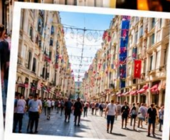
ISTIKLAL STREET (Grand Avenue of Pera) ถนนสายช้อปปิ้ง อิม บิล ครบจบในที่เดียว