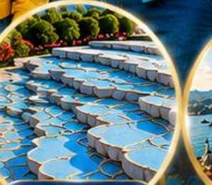
ปามุกคาล่ Pamukkale