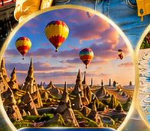
เมืองคปปาโดเกีย Cappadocia