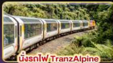
นั่งรถไฟ TransAlpine