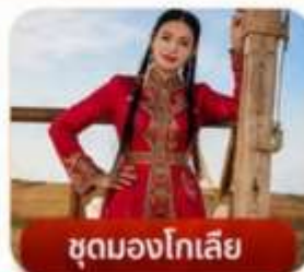
ชุดมองโกเลีย