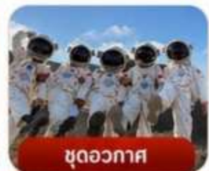
ชุดอวกาศ