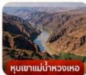
หุบเขาแม่น้ำหวงเหอ