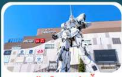
ห้างไดเวอร์ซิตี