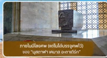
ภายในมีโลงศพ (แต่ไม่ได้รับอนุญาตให้เข้า) ของ "มุสตาฟา เคมาล อะตาเติร์ก"