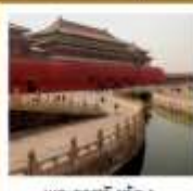
พระราชวังปักกิ่ง