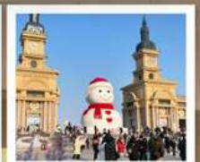
ตึกตาคิยะยักซ์