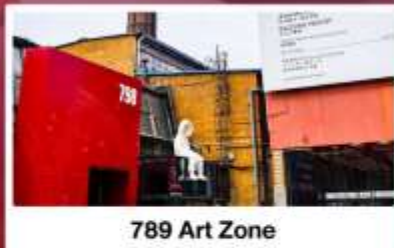
798 Art Zone