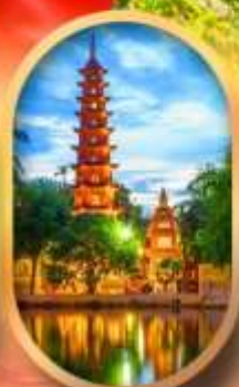
วัดเจินท๊วก