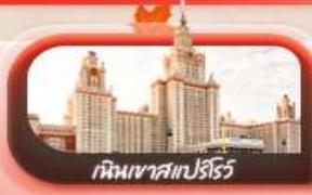
เหมินเวสแปร์ริว