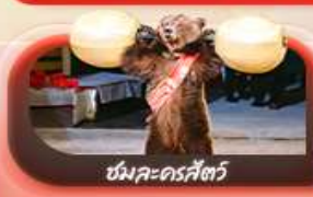
ขั้มละครีตซ์

เส้นทาง 09-16 ต.ค.69 / 15-22 ต.ค.69 / 22-29 ต.ค.69