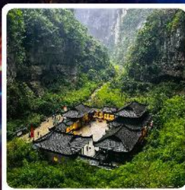
อุทยานแห่งชาติหลุมบ่อฟ้า

ไฮไลท์! อุทยานแห่งชาติหลุมบ่อฟ้า มรดกโลกระดับ 5A รถไฟฟ้าทะลุтик ตึกตะกียบ อลังการแสงสีหงหยาดฉิ่ง