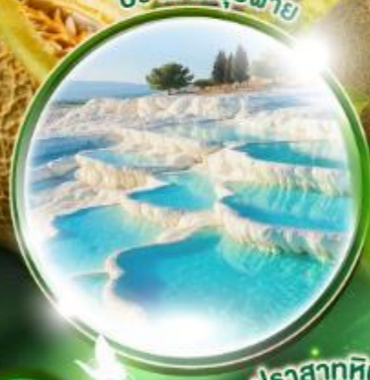
ปราสาทหินยุคซาร์