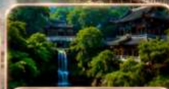
ถนนโบราณเจียฟางเป่ย์