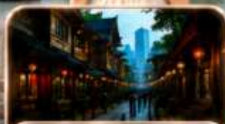
หมู่บ้านโบราณฉือซีโซ่ว