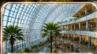
THE RING MALL CHONGQING