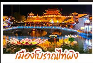
เมืองโบราณที่ผิง