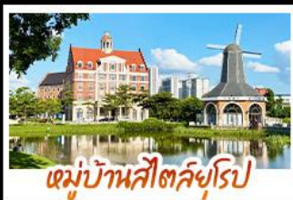
หมู่บ้านสโตนลึกลับ

ล่องเรือชมดอกไม้สีขาวบานเหนือสายน้ำ ณ เมืองคูอินเสียงส่าย หนึ่งปีมีหนึ่งครั้ง ถ่ายรูปเช็คอินแบบชิคๆ ณ หมู่บ้านสโตนลึกลับ • ชม UNSEEN แห่งป่าหม่า ล่องเรือชมทะเลในท่า ถ้ำ ซันเหมินไห่ เหมือนแคคตัสสวรรค์ • ชมน้ำพุร้อนฟ้า ที่ท่องเที่ยวระดับ 4A • ชมความอลังการของ น้ำตกสองแผ่นดิน จีน-เวียดนาม ณ เต๋อเทียน • ทำน้ำแข็งหลอดกับประติมากรรมน้ำแข็งสวยงาม และอากาศดีลบล • ชมดอกไม้คามฤดูแล้ง ณ เวาชิงชิว พร้อมขอพรเจ้าแม่กวนอิมพันก