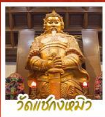
วัดเข่งหนิว