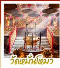
วัดมื่นไทมว