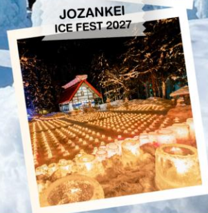
JOZANKEI ICE FEST 2027

วันเดินทาง 27 ม.ค. - 1 ก.พ. 2570 29 ม.ค. - 3 ก.พ. 2570