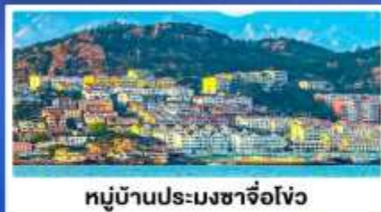
หมู่บ้านประมงซาโจ่ว