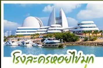
โรงละครเซียวไห่หมุก