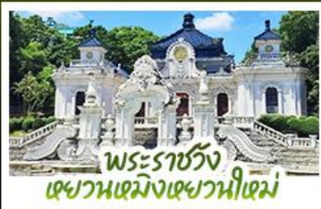
พระราชวัง เฉวานเหมิงเฉวานหนี่เหม่