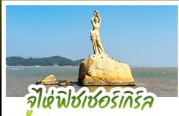
จูไห่ฟิชเชอร์เกิร์ล