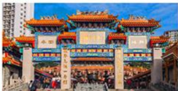
วัดเข้ว้งต้าเซียน