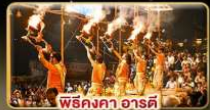
พิธีคงคา อารตี