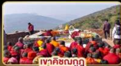
เทศกาลมฤก