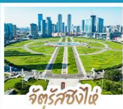
จัตุรัสชิงไผ่