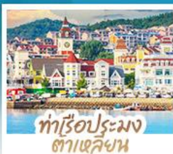
ทำเรือประมง ต้าเหลียน