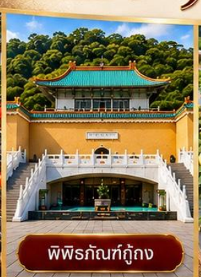
พิพิธภัณฑท์กู๊กง