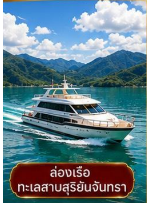
ล่องเรือ ทะเลสาบสุริยันจันทรา