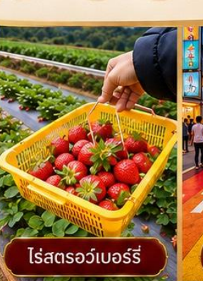
ไร่สตอร์วเบอร์รี่