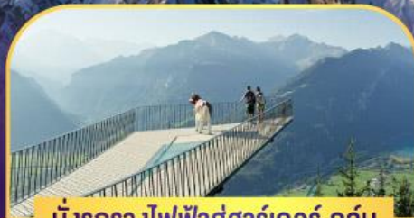
นั่งรถรางไฟฟ้าสู่ชาร์เดอร์ คูลัม