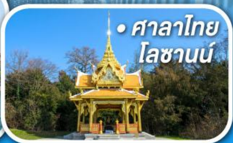
• ศาลาไทย โลซานน์