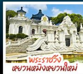
พระราชวัง เซวานเมิ่งเซวานีเซม