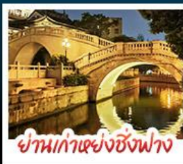
ย่านเก่าแห่งซิงฟาง