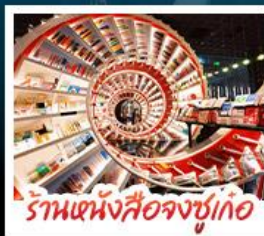
ร้านหนังสือจุงซูเกอ