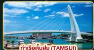
ท่าเรือต้นสุ่ย (TAMSUI)