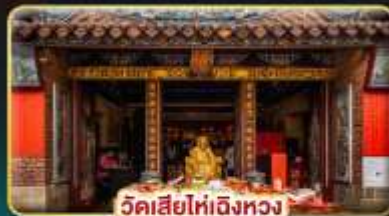
วัดสี่ยี่ไท่เอ็งทวง