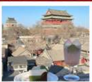
คาเฟ่ น้ำตาล