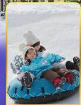
กิจกรรม ณ ลานสกี