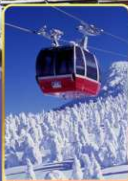
นั่งกระเช้าขึ้นเขาซาโอะ