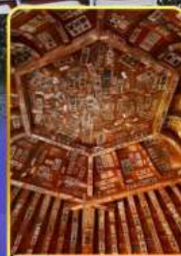
วัดซาชะเอโดะ