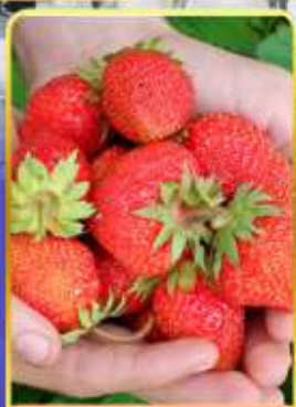
กิจกรรมเก็บสตอเบอร์รี่