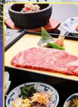
ROKKASEN พรีเมียม

ออนเซน 4 คืน นน.กระเป๋า 1 ใบ / 23 กก. 9Days 6Night