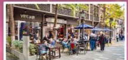
จีนเกียนตี้