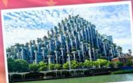
ตึกไข่มุก