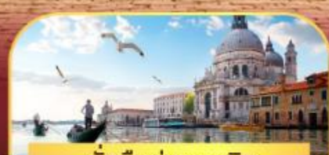
นั่งเรือสุทเกาะเวนิส