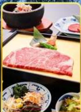
บิ๊งย่าง ROKKASEN