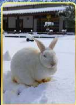
หมู่บ้านกระต่ายคางะ