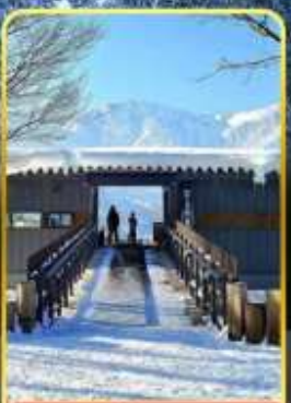
ฮาคุบะอิวาตาคะ