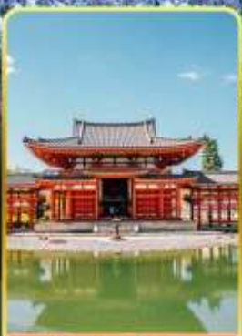
วัดเมียวโด้อิน