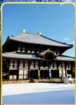
นาราโกโตจิ

พิเศษพักในเมืองคุสัทสึออนเซ็นพร้อมชมยูบาคาเกะ