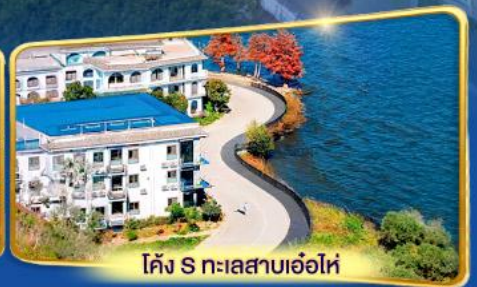
โค้ง S ทะเลสาบเอ่อไห่