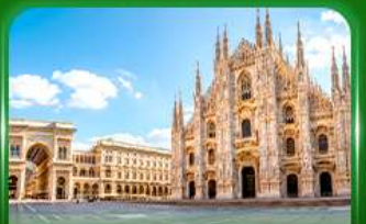
มหาวิหารดูโอโมแห่งมิลาน