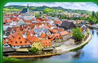
เมืองมรดกโลก เซสท์ครุมลอฟ