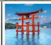
ศาลเจ้าอิตสึชิมะ