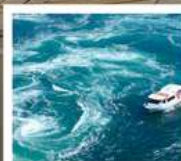
คลองเรือชมน้ำวนมาตุระ

วัดบึงชอน / ตลาดกึ่งะ / โบสถ์ภาวน์ (จุดชมวิว) / สะพานคินไตเคียว เกาะมียาจิมา ศาลเจ้าอิตสึชิมะ / สวนอนุสรณ์สันติภาพฮิโรชิมา โดโกะออนเซ็น / ถนนโอโมเตะซันโด คมปีระซัง / ปราสาทตสึยามา กิจกรรมทำเส้นอุด้ง / สวนริทสึริน / สถานีรับทางคุรุคุรุมาตุระ คลองเรือชมน้ำวนมาตุระ / ซุปบึงย่านชินโซบาช / ตลาดปลาคุโรเมง / ซุปบึงย่านอุมาเดะ