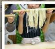
กิจกรรมทำเส้นอุด้ง