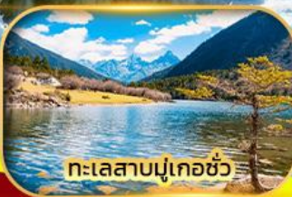
ทะเลสาบมู่เกอซัว