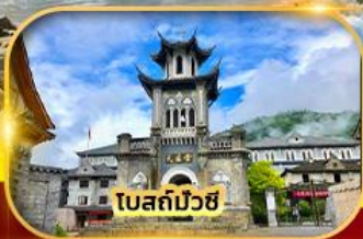
โบสถ์บ๊วยซี