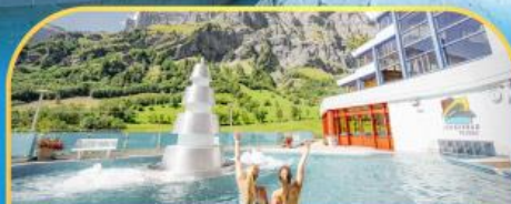
แช่น้ำแร่ร้อนผ่อนคลายลวยคอร์บิค