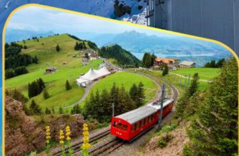
นั่งรถไฟขึ้นสู่ยอดเขาโรทิก