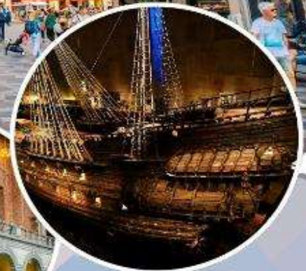
เข้าชม "พิพิธภัณฑ์เรือวาซา"