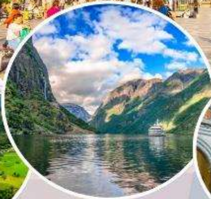
ล่องเรือ "Nærøysfjord"