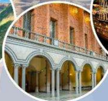
เข้าชมศาลาว่าการ กรุงสต็อกโฮล์ม