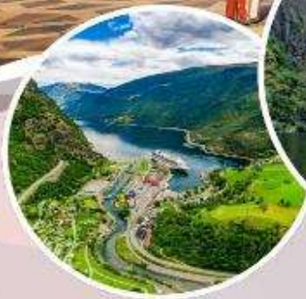
บั้งรถไฟสายโรแมนติก "Flamsbana"