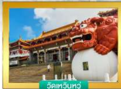
วัดเทวินหัว