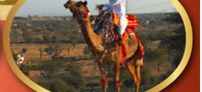
ฟรี ขี่อูฐ เมืองมันทาวา ราคาเริ่มต้น