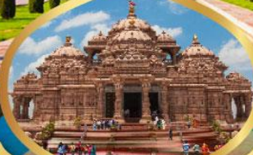
วิหารอักซาร์ดีม