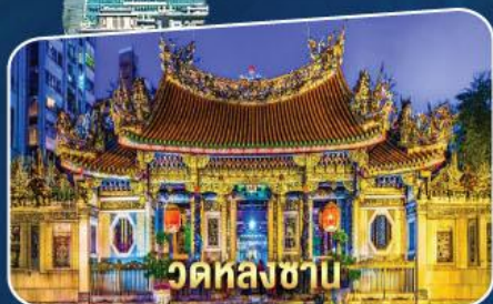
วัดหลงซา